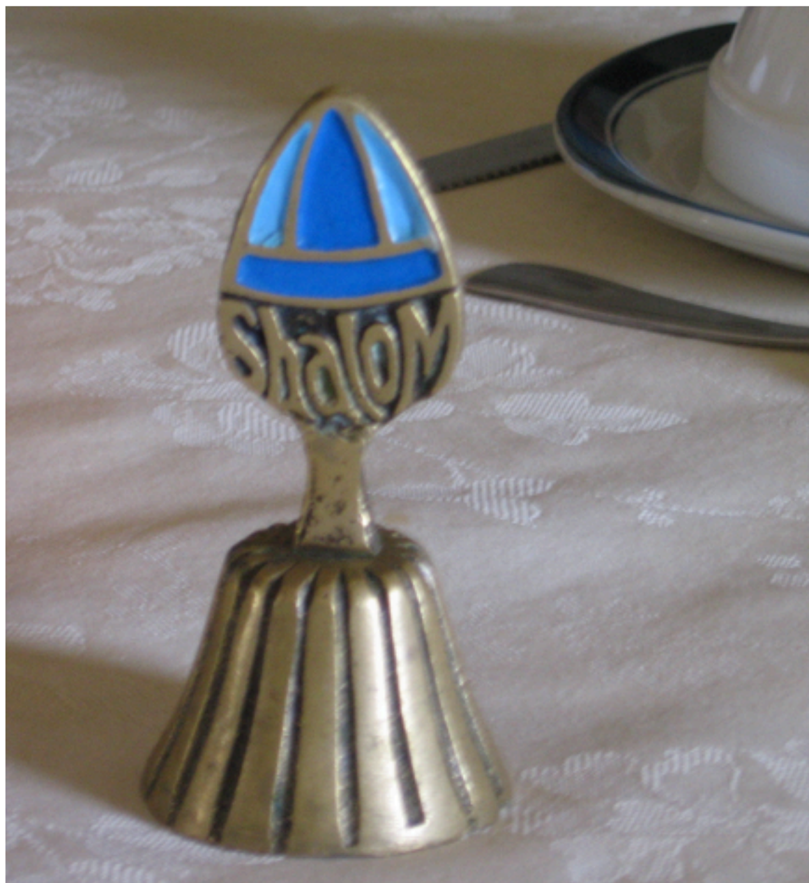
C'est une cloche pour sonner le repas dans un monastère catholique